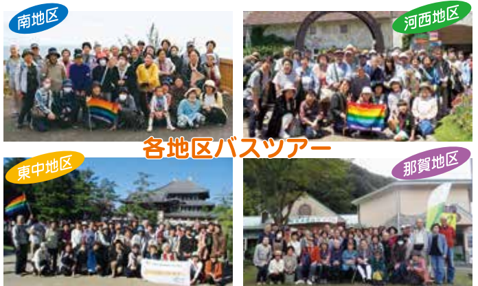
各地区バスツアー